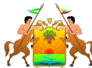
Gobernación de Meta