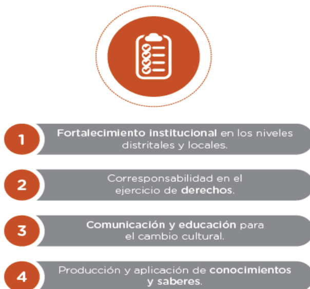
Gráfica 1: Procesos Estratégicos de la Política Pública LGBTI