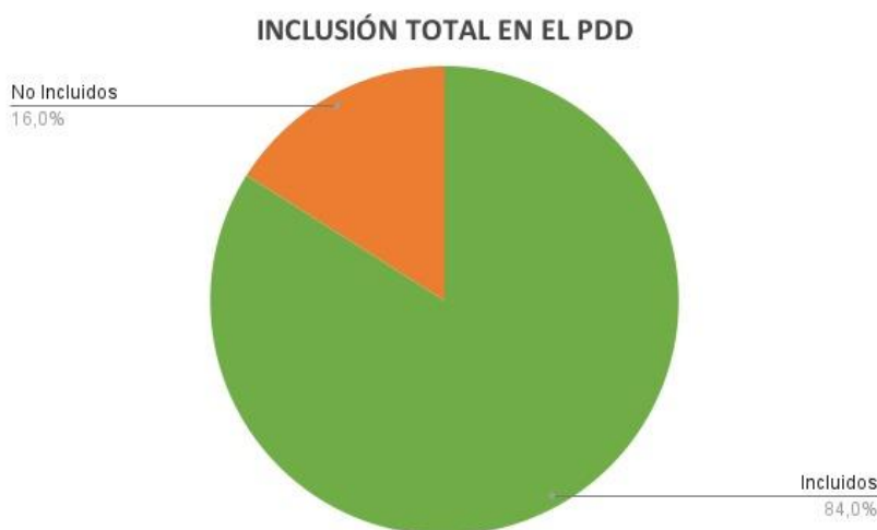
Gráfica 1 Porcentaje de propuestas incluidas en el PDD