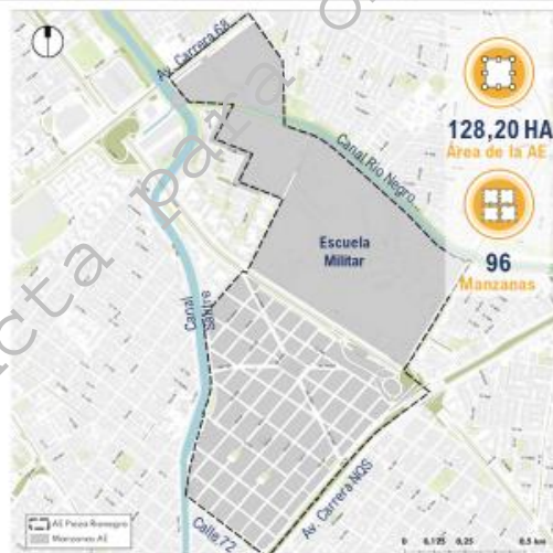
1 DELIMITACIÓN PREVIA