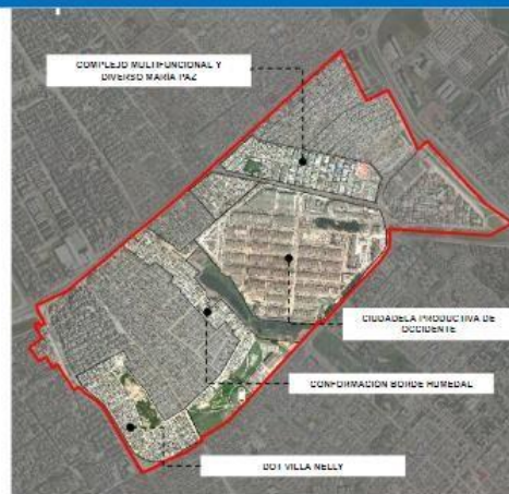
Ámbitos definidos en la propuesta Se conserva la misma delimitación

Asimismo, habla de la importancia de poder activar el borde con lo que pasa después del muro, pues hay problemas de inseguridad y parqueo en vía que afectan a los residentes. Expone que el objetivo de la Actuación Estratégica es desconcentrar y activar el borde de Corabastos, generar empleo, fortalecer la conectividad ecológica (Humedal La Vaca Sur y Norte), fortalecer el desarrollo y construcción de infraestructura para el sistema