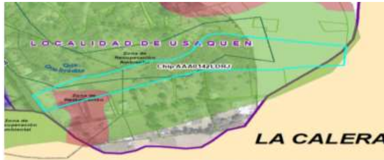
Localización predio AAA0142LDRJ

2. En relación con la normatividad que regula este predio, en el artículo 399 del Decreto Distrital 190 de 2004 -POT se establece: