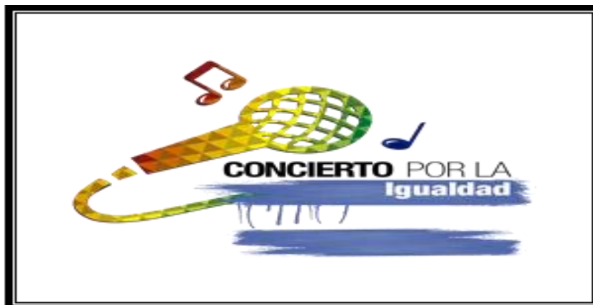
Fuente: IV Semana por la Igualdad 2014 Dirección de Diversidad Sexual - SDP