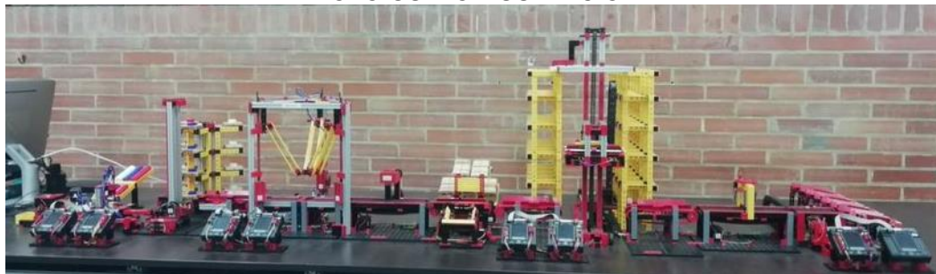
Imágenes solo como referencia