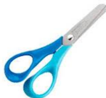
Imágenes solo como referencia