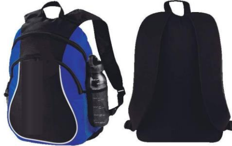
Imágenes solo como referencia