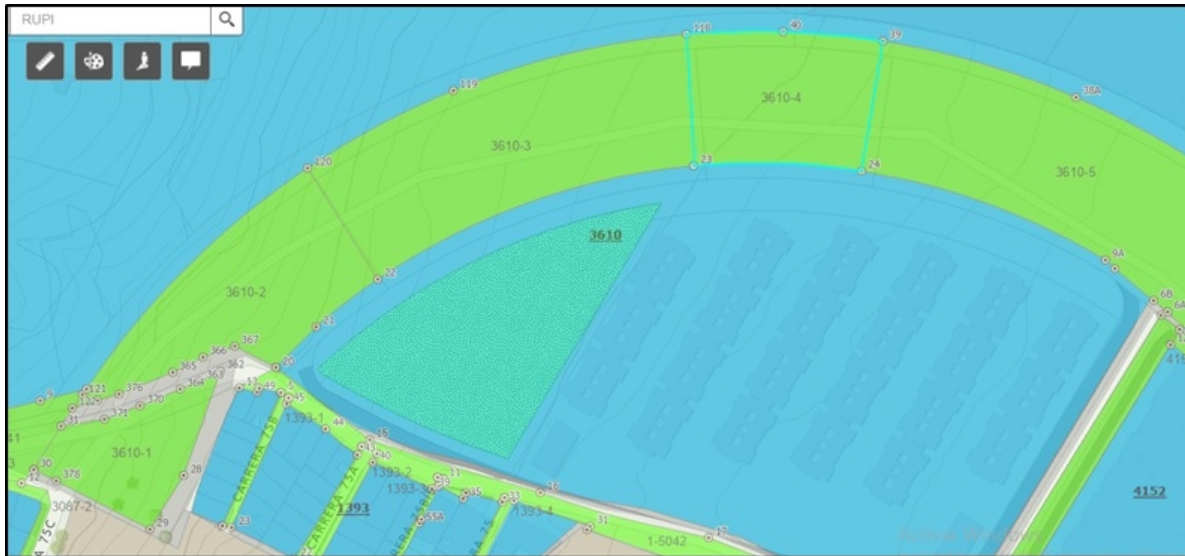
Situación del predio en SIGDEP

Adicional a lo anterior el predio en cuestión cuenta con numero de Registro en el inventario de bienes de uso público del Departamento Administrativo de la Defensoría del Espacio Público de Bogotá, exactamente numero Rupi 3610-4, tal como se evidencia en el SIGDEP así: