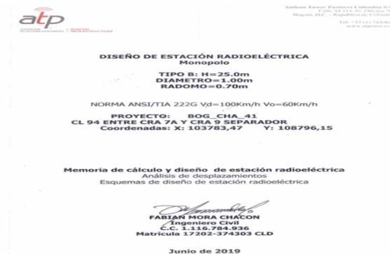
Gráfico N° 7 – Información de diseño de la estructura de la estación radioeléctrica- Radicado SDP N° 1-2019-57539

Teniendo en cuenta la altura de la estación y su diseño presentado como se evidencia en la imagen anterior, la cual es de 25 metros incluyendo el pararrayos, y que los equipos se encuentran dentro de la estructura, el diámetro del monopolo es de 1 metro, y no corresponde con el diseño inicialmente planteado en la radicación inicial y sobre el cual se realizaron las observaciones y requerimientos técnicos.