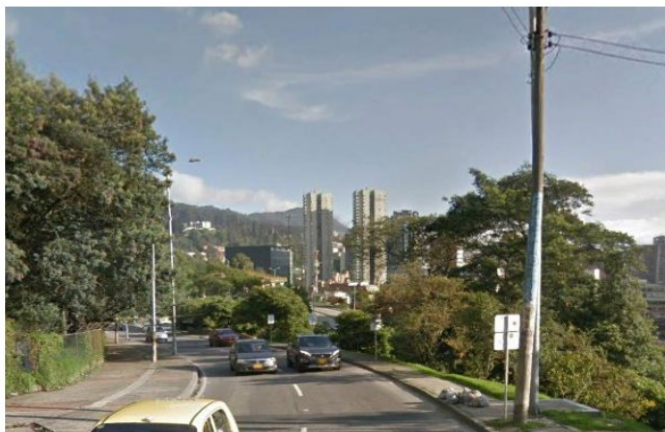
Ilustración 2. Fotografías del sector con presencia de postes de servicios públicos y luminarias.

2. Así mismo dentro de la propuesta de mimetización realizada bajo lo dispuesto en el manual de mimetización y camuflaje para estaciones radioeléctricas en el ítem 4 "Estrategia de Mimetización" se establece: "Según el manual de mimetización y camuflaje para estaciones radioeléctricas para la instalación de estaciones en espacio público y según la matriz de evaluación de impacto el puntaje obtenido es de 19, el impacto es bajo por tal motivo se deben mimetizar con elementos de mobiliario