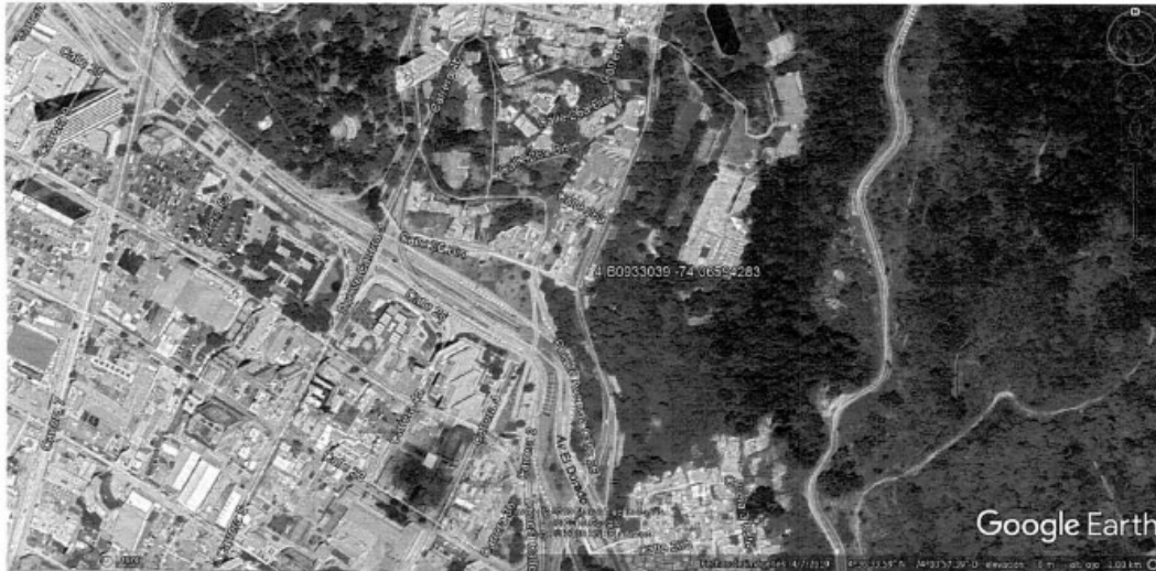
Imagen 1. Localización según coordenadas

Precisado lo anterior, se informa que una vez consultada la base de datos del inventario de Bienes de Interés cultural, con la que cuenta este Instituto, en relación con la localización de la estación radioeléctrica temporal a instalar, y conforme a la información recibida en su comunicación, se pudo verificar que el lugar de la intervención corresponde a la "CARRERA 3 CON CALLE 26 BIS", el cual se localiza en el Sector de Interés Cultural de Desarrollo Individual denominado " Bosque Izquierdo ", barrio "008106-BOSQUE IZQUIERDO", UPZ 92 – La Macarena de la Localidad 3 Santa Fe (Ver imagen No. 1).