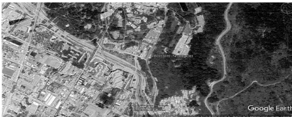
Imagen 1. Localización según coordenadas

"(...) una vez consultada la base de datos del inventario de bienes de Interés cultural, con la que cuenta este Instituto, en relación con la localización de la estación radioeléctrica temporal a instalar; y conforme a la información recibida en su comunicación se pudo verificar que el lugar de la a la "CARRERA 3 CON CALLE 26 BIS", el cual se localiza en el Sector de Interés Cultural de Desarrollo Individual denominado "Bosque Izquierdo", barrio "008106-BOSQUE IZQUIERDO", UPZ 92-La Macarena de la Localidad 3 Santa Fe (Ver imagen No. 1).