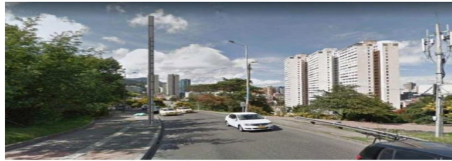
Ilustración 4. Simulación gráfica.

DÉCIMO SEGUNDO: De todo lo expuesto se puede observar que la motivación del acto administrativo no solo vulnera el derecho fundamental al debido proceso, sino que se configura una falta de motivación pues sin haberse surtido todas las etapas del proceso, no era posible adoptar una decisión concreta, definitiva y de fondo.