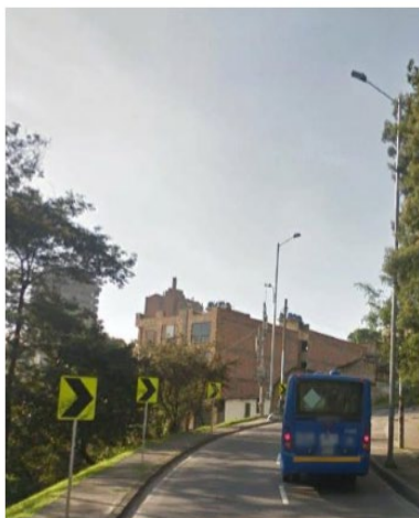
Ilustración 1.3. Fotografías del sector con presencia de postes de servicios públicos y luminarias.

1. En el sector definido para la propuesta de instalación para la estación radioeléctrica BOG_SAN_09 hay presencia de luminarias y postes de servicios públicos cuyas características son muy similares en color, diámetro y altura a la estación como se aprecia a continuación: