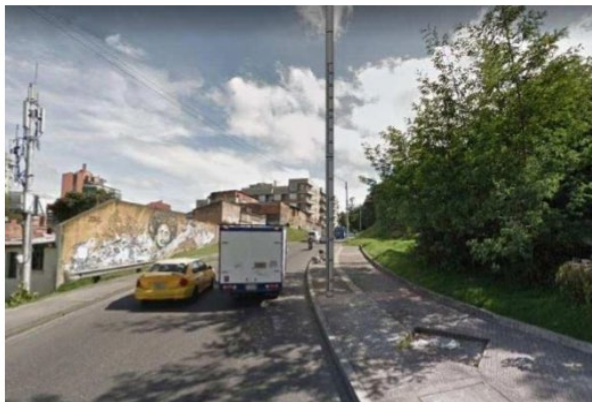
Ilustración 3. Simulación gráfica.

Se plantea realizar la mimetización de la estación radioeléctrica así de esta manera se desea lograr que el impacto de la estructura sobre el entorno, medio ambiente y los seres humanos sea mínimo, conservando los elementos necesarios de seguridad. La mimetización del sitio se realizará proporcionando un acabado en color galvanizado propio de la estructura y pintura gris, esto de acuerdo con que este es un color neutro permite formar un conjunto armónico visual en la zona, y se vincula con los postes de iluminación de la ciudad, como se indicó dentro de contexto aplicable."