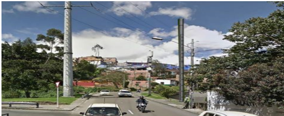
Ilustración 3 Simulación grafica 3D de la estación radioeléctrica BOG_CAN_07

DÉCIMO SEGUNDA: Al negar el Concepto de Factibilidad, la Secretaría Distrital de Planeación atenta contra la necesidad del servicio de telecomunicaciones de las Localidad de LA CANDELARIA , pues a través del Decreto Legislativo 464 de 2020, el Gobierno Nacional declaró los servicios de telecomunicaciones como un servicio público esencial e impuso a las compañías de telecomunicaciones la obligación de continuar ejecutando sus labores de "instalación, mantenimiento y adecuación de redes requeridas para la operación del servicio" con el fin de asegurar la prestación efectiva y de calidad de tales servicios a la población colombiana.