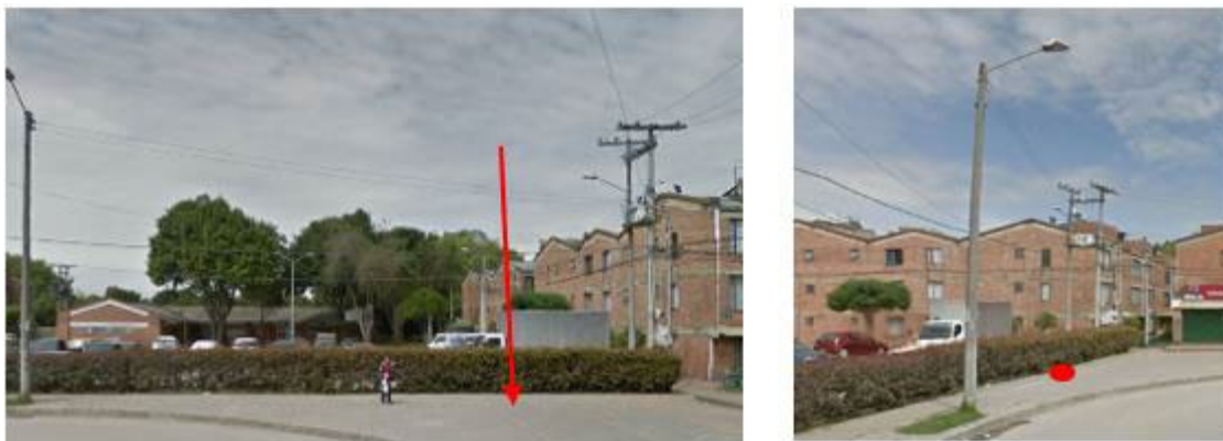
Ilustración 2. Contexto urbano del sitio BOG_SUB_03.

SEGUNDO: El 07 de octubre del año 2.020, se notificó a ATP la Resolución 1221 de fecha 01 de octubre del año 2.020 "Por medio del cual se NIEGA la viabilidad del concepto de factibilidad para la ubicación de los elementos que conforman una Estación Radioeléctrica denominada