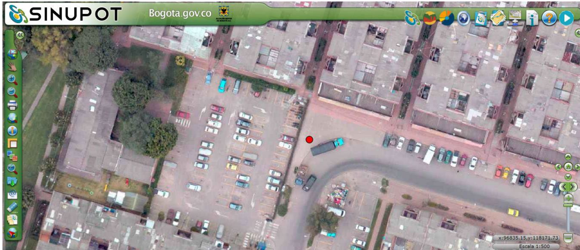
Ilustración 1. Ubicación Sinupot