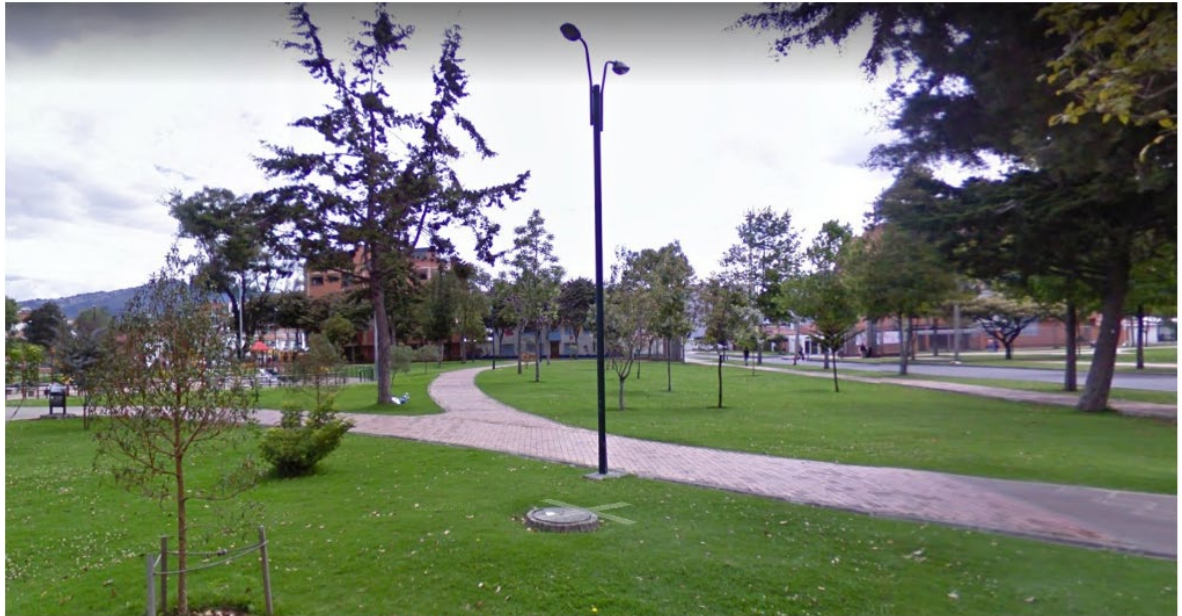
IMAGEN UBICACIÓN PROPUESTA