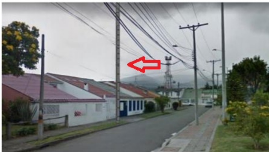
Ilustración 2. Mimetización propuesta en localización definitiva BOG_SUB_20

En efecto, al no tratarse de un parque sino de un andén, la entidad competente para emitir un concepto por ser administradora del espacio público podría ser el Instituto de Desarrollo Urbano – IDU, del cual no obra pronunciamiento alguno dentro del expediente. En esas condiciones, no podía la Secretaría emitir un pronunciamiento favorable, sin contar con el concepto de la entidad competente, lo cual refuerza el argumento según el cual, la parte interesada debió presentar una nueva solicitud con los requisitos técnicos, urbanístico y jurídicos, acordes con la ubicación del nuevo lugar de instalación de la antena.