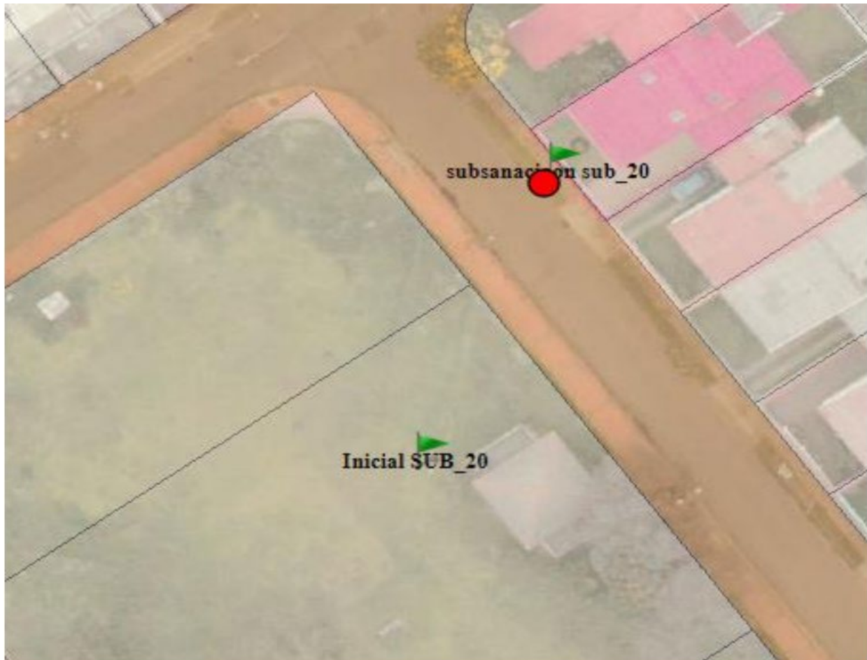
Ilustración 1. Localización de coordenadas propuestas

EVITE ENGAÑOS: Todo trámite ante esta entidad es gratuito, excepto los costos de reproducción de documentos. Verifique su respuesta en la página www.sdp.gov.co link "Estado Trámite". Denuncie en la línea 195 opción 1 cualquier irregularidad.