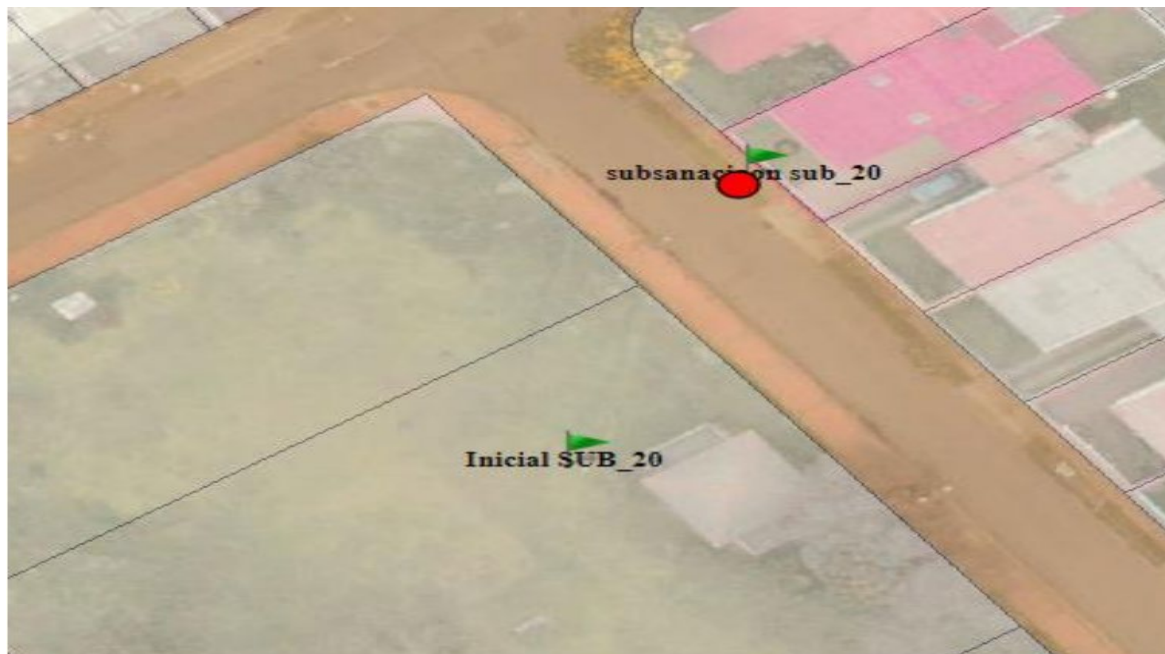
Ilustración 1. Localización de coordenadas propuestas