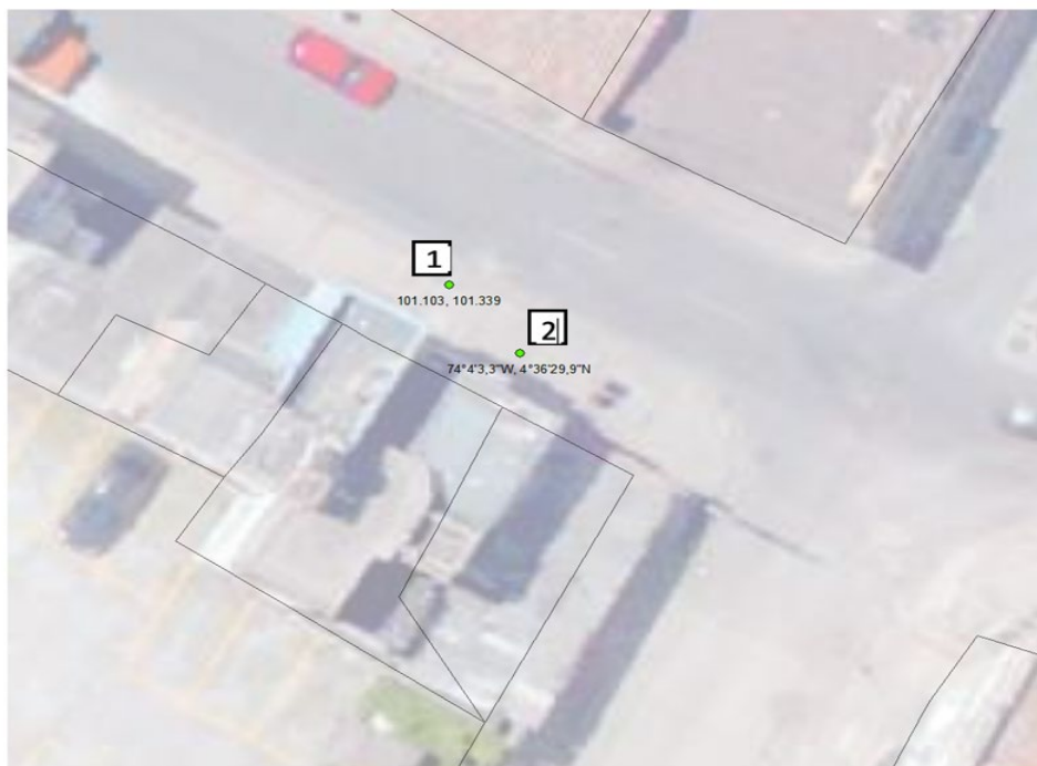
Imagen N°3. Verificación y georreferenciación de las coordenadas geográficas correspondientes a la solicitud de permiso para la ubicación de los elementos que conforman una estación radioeléctrica denominada: BOG_SAN_13 y la autorización de altura aportada por el solicitante.

1. Ubicación por coordenadas concepto de Factibilidad.