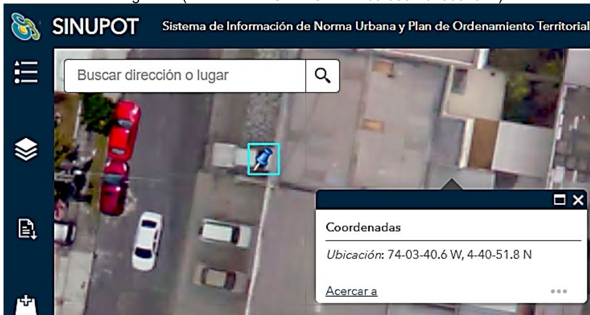
Imagen 2 - (Localización UAEAC No.4109.085-2019037914)

De acuerdo con el sistema de información de norma urbana y plan de ordenamiento territorial SINUPOT , las coordenadas presentadas en el oficio No. 4109.085-2019037914 expedido por la Unidad Administrativa Especial de la Aeronáutica Civil – UAEAC ( AEROCIVIL ) de la estación radioeléctrica BOG BAR 07 se encuentran fuera de la franja de mobiliario y paisajismo, (Imagen 2).