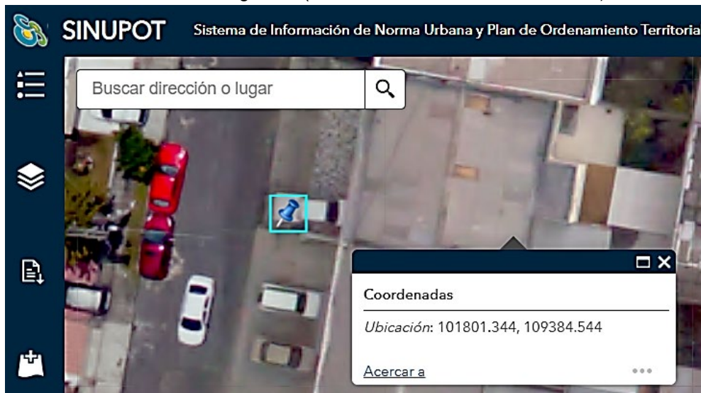
Imagen 1 - (Localización factibilidad M-FO-157)

estación radioeléctrica en espacio público y/o bien de uso público” denominada “ BOG BAR 07 ”, a ubicarse en el ANDEN de la CARRERA 48 CALLE 93 VÍA CERRADA en la localidad de Barrios Unidos de la ciudad de Bogotá, D.C., en las coordenadas Planas (MAGNA_Bogota_DC_2005) Este (X) = 101801.344 y Norte (Y)= 109384.544. De acuerdo con el sistema de información de norma urbana y plan de ordenamiento territorial SINUPOT , la estación radioeléctrica se encuentra dentro de la franja de mobiliario y paisajismo (Imagen 1).