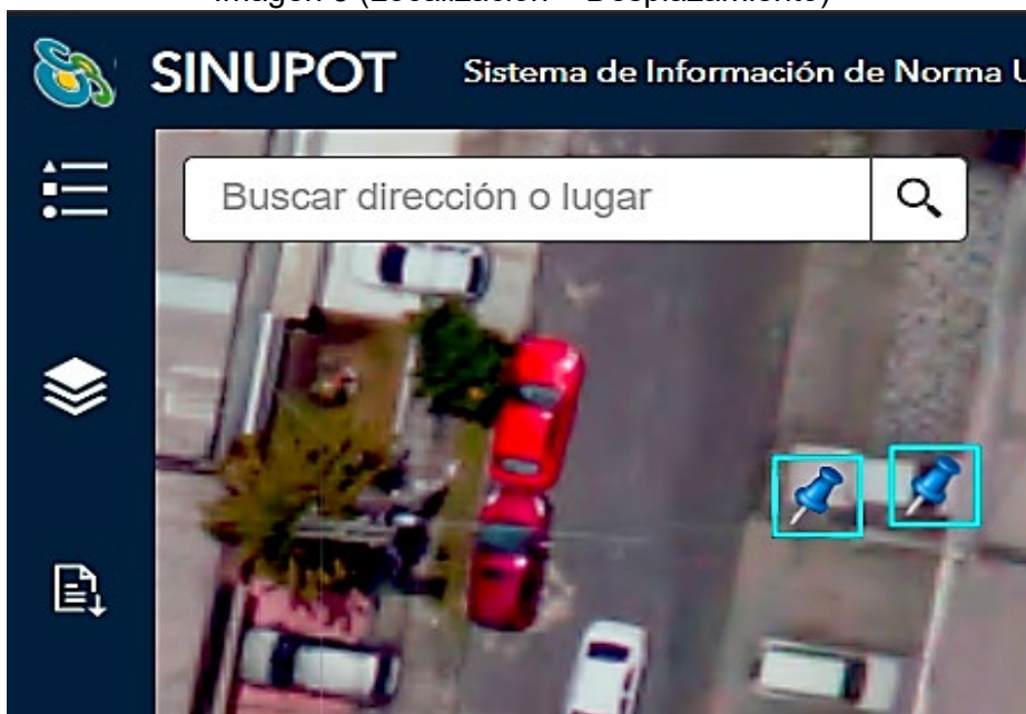
Imagen 3 (Localización – Desplazamiento)