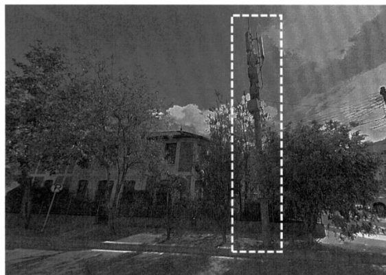
Punto en el cual se pretende instalar la nueva estación radioeléctrica en las coordenadas X: 4.624898812, Y: -74.07210542 ya existe sin autorización.

EVITE ENGAÑOS: Todo trámite ante esta entidad es gratuito, excepto los costos de reproducción de documentos. Verifique su respuesta en la página www.sdp.gov.co link "Estado Trámite". Denuncie en la línea 195 opción 1 cualquier irregularidad.