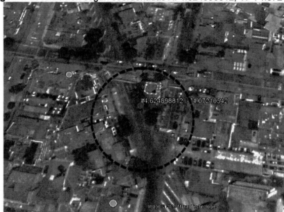
Imagen 1. Localización según coordenadas X: 4.624898812, Y: -74.07210542

“(…) Preciso lo anterior, se informa que una vez consultada la base de datos del inventario de Bienes de Interés cultural, con la que cuenta este Instituto, en relación con la localización de la estación radioeléctrica temporal a instalar, y conforme a la información recibida en la comunicación, se pudo verificar que el lugar de la intervención corresponde al andén del costado sur de la transversal 7ª Bis entre calle 35 y carrera 17; del barrio Teusaquillo; el cual se localiza como Sector de Interés Cultural – Sector con Desarrollo Individual-, denominado “Teusaquillo”, que hace parte del patrimonio construido de la ciudad, de conformidad con las determinaciones de los artículos 123 y 124 del Decreto 190 de 2004. Este Sector de Interés Cultural, está reglamentado en la norma urbana vigente de la Unidad de Planeamiento Zonal de la UPZ101-Teusaquillo, adoptada mediante Decreto Distrital 492 de 2007, sector normativo No. 4, Área de Actividad Central, Tratamiento: Conservación. Modalidad: Sector de Interés Cultural – Desarrollo individual.