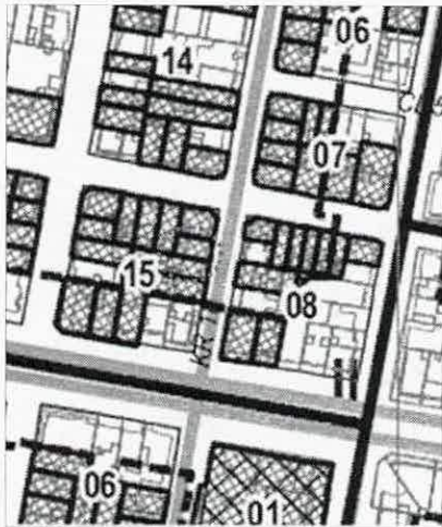
Localización del inmueble en UPZ

No tiene un lenguaje sobresaliente en el sector, sino por el contrario, austero y respetuoso con su contexto inmediato.