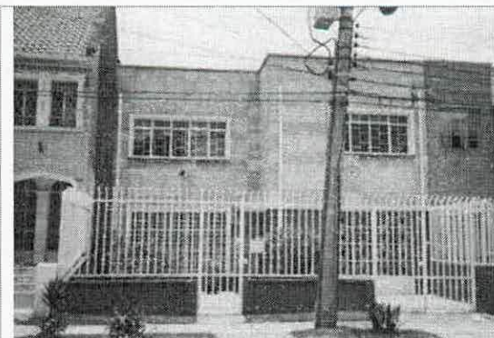
Fotografía de archivo / Ficha de Valoración

La casa presenta agrietamientos importantes y se inclinó hacia el costado sur, amenazando daños al inmueble vecino. Adicionalmente, expone que la remodelación es muy costosa, y por ser personas mayores, no poseen recursos.