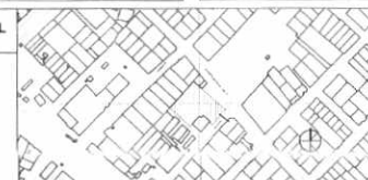
LOCALIZACIÓN GENERAL - ESC. 1/5000

Nota: Los Corredores urbanos deberán acatar las disposiciones de la Resolución expedida y verificar la concordancia del proyecto con las normas urbanísticas vigentes.