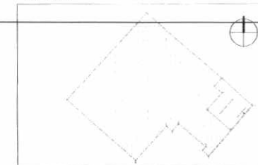
ESQUEMA INDICATIVO ÁREAS DE MITIGACIÓN Y ACCESOS ESC. 1:1000