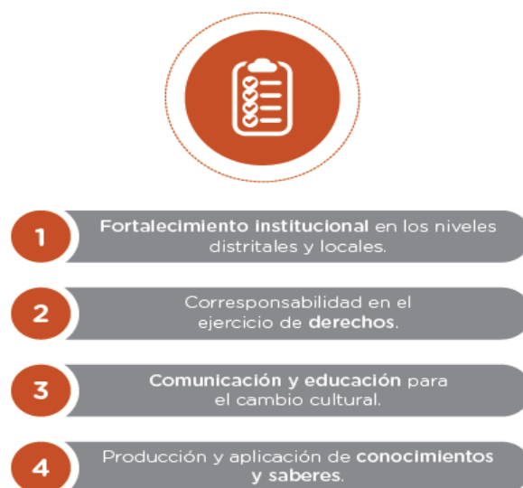
Gráfica 1: Procesos Estratégicos de la Política Pública LGBTI