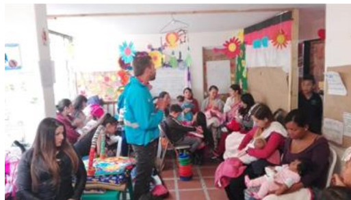
Asociación Esperanza y Progreso – barrio Bilbao – 18 junio de 2019

De las jornadas de educación realizadas en el aula Mirador de los Nevados, dirigidas a familias se involucraron un total de 174 personas.